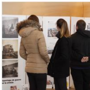
Le dessous des images