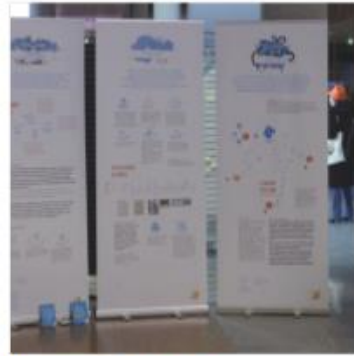
Mieux connaître les médias

Cette présentation vous propose des extraits visuels des ateliers.